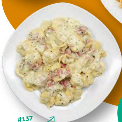
#137 Tortellini »Panna«